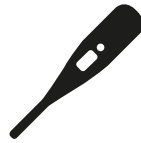
Verhoging of koorts