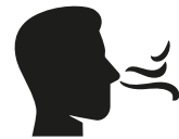
Reuk- en/of smaak- verlies

Heb je op dit moment een huisgenoot met milde klachten en koorts en/of benauwdheid?